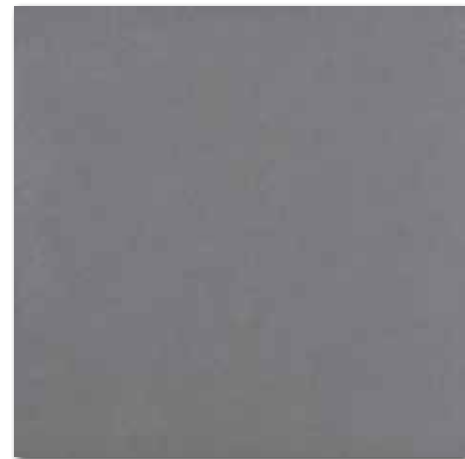
DAK63655 Trend PEI 4 82 / m 2 mat | matt

tmavě šedá / dark grey / ciemnoszara темно-серый / sötétszürke / gris oscuro