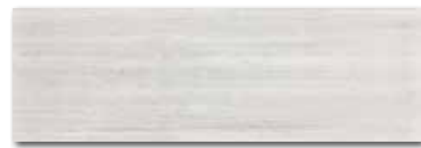
WADVE027 82 / m 2 lesk | glossy

světle šedá / light grey / jasnoszara светло-серый / világosszürke / gris claro