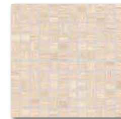
WDM02230 (SET) 78 / set mat/lesk | matt/glossy

béžová / beige / bežowa / бежевый / bézs / beige