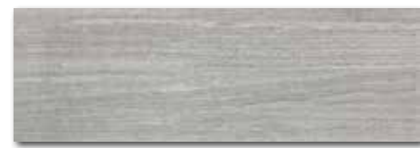
WADVE028 82 / m 2 lesk | glossy