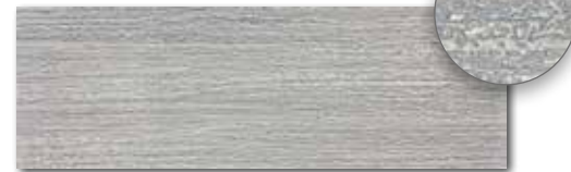
WITVE128 74 / ks mat | matt