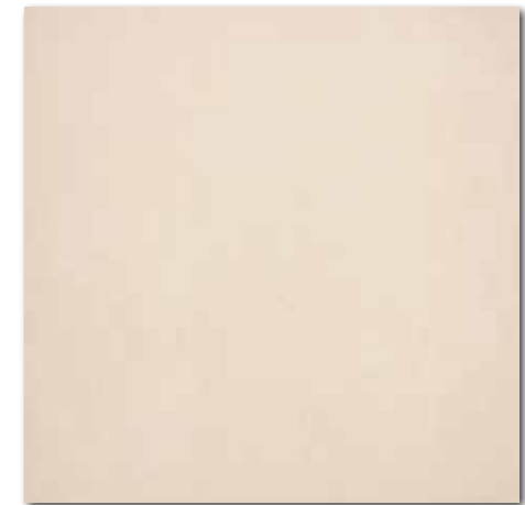
DAK63658 Trend PEI 5 82 / m 2 mat | matt

šedá / grey / szara / серый / szürke / gris