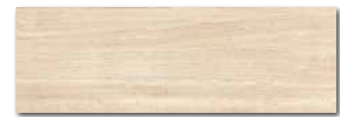
WADVE030 82 / m 2 lesk | glossy