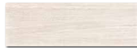
WADVE029 82 / m 2 lesk | glossy

světle béžová / light beige / jasnobežowa светло-бежевый / világosbézs / beige claro