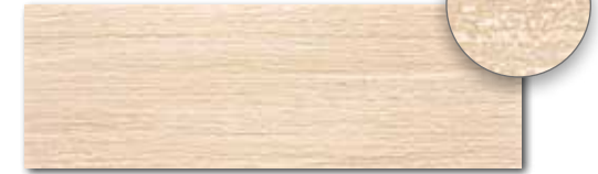
WITVE130 74 / ks mat | matt