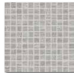
WDM02228 (SET) 78 / set mat/lesk | matt/glossy