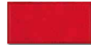
WADMB225 82 / m 2 lesk | glossy | V2