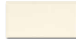
WADMB124 82 / m 2 lesk | glossy