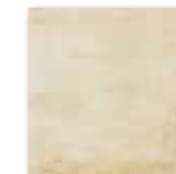
DAR2W663 Siena PEI 5 82 / m 2 mat | matt