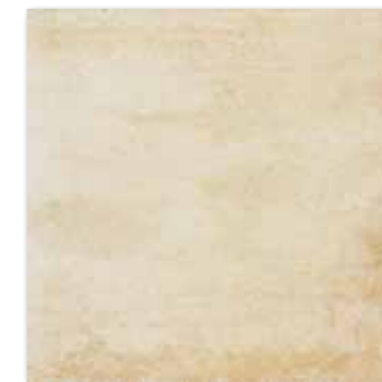
DAR44663 Siena PEI 5 78 / m 2 mat | matt

světle béžová / light beige / jasnobeżowa / светло-бежевый világosbézs / beige claro