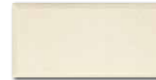
WADMB224 82 / m 2 lesk | glossy | V2