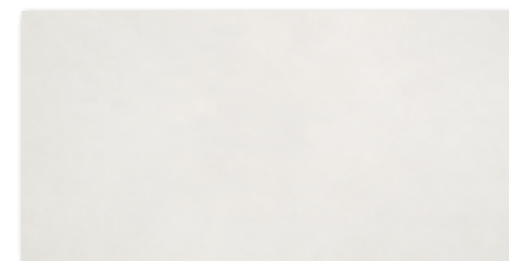
WARV4562 Ø 80 / m 2 mat | matt

béžová / beige / beżowa / бежевый / bézs / beige