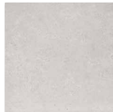
DAK63432 Base PEI 5 Ø 86 / m 2 mat | matt

světle šedá / light grey / jasnoszara светло-серый / világosszürke / gris claro