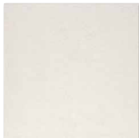
DAK63430 Base PEI 5 Ø 86 / m 2 mat | matt

bílá / white / biata / белый / fehér / blanco