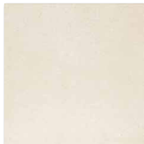
DAK63431 Base PEI 5 Ø 86 / m 2 mat | matt

světle béžová / light beige / jasno-beżowa светло-бежевый / világosbézs / beige claro