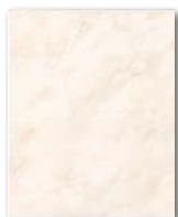
WAAGX105 ○ 56 | m 2 mat | matt