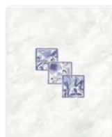
WITGX110 ○ 22 | ks lesk | glossy