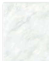
WAAGX106 ○ 56 | m 2 mat | matt