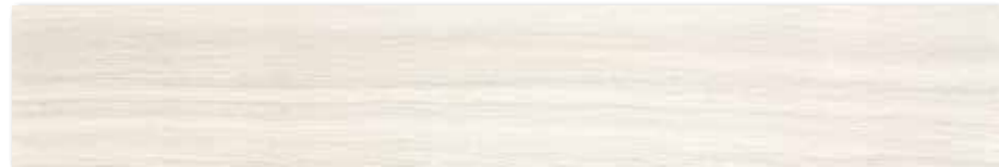
DAKVG140 PEI 5 ○ 98 / m 2 mat | matt

světle šedá / light grey / jasnoszara / светло-серый / világosszürke / gris claro