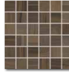
DDM06144 (SET) PEI 4 ○ 72 / set mat | matt

hnědá / brown / brązowa / коричневый / barna / marrón