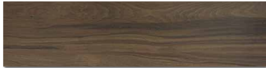
DAKVF144 PEI 4 ○ 98 / m 2 mat | matt