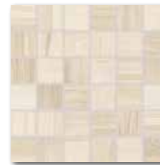
DDM06141 (SET) PEI 5 ○ 72 / set mat | matt

světle béžová / light beige / jasnobezowa / светло-бежевый / világosbézs / beige claro