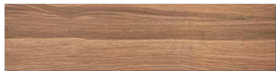
DAKVF143 PEI 4 \odot 98 / m 2 mat | matt