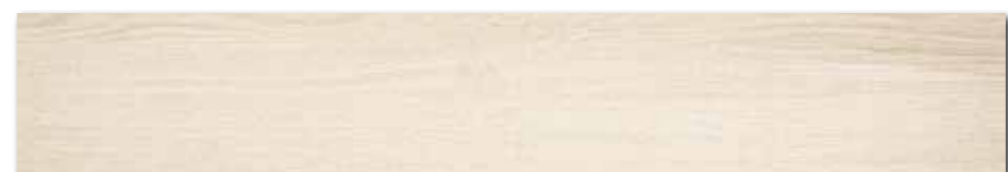
DAKVG141 PEI 5 \odot 98 / m 2 mat | matt

světle béžová / light beige / jasno-bežowa / светло-бежевый / világosbézs / beige claro