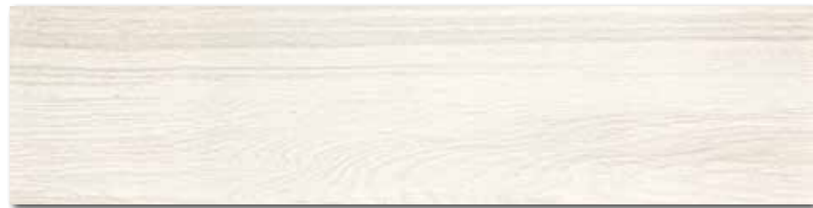
DAKVF140 PEI 5 ○ 98 / m 2 mat | matt