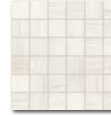
DDM06140 (SET) PEI 5 ○ 72 / set mat | matt

tmavě hnědá / dark brown / ciemnobrązowa / темно-коричневый / sötétbarna / de color marrón oscuro