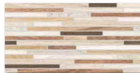
DDPSE023 PEI 4 ○ 86 / ks mat | matt

vícebarevná / multicoloured / kolorowa / многоцветный / többszínű / multicolor