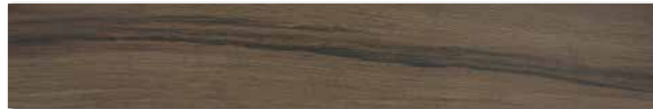
DAKVG144 PEI 4 ○ 98 / m 2 mat | matt

tmavě hnědá / dark brown / ciemnobrązowa / темно-коричневый / sötétbarna / de color marrón oscuro