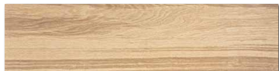
DAKVF142 PEI 4 \odot 98 / m 2 mat | matt