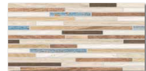
DDPSE467 PEI 4 ○ 86 / ks mat | matt

vícebarevná / multicoloured / kolorowa / многоцветный / többszínű / multicolor