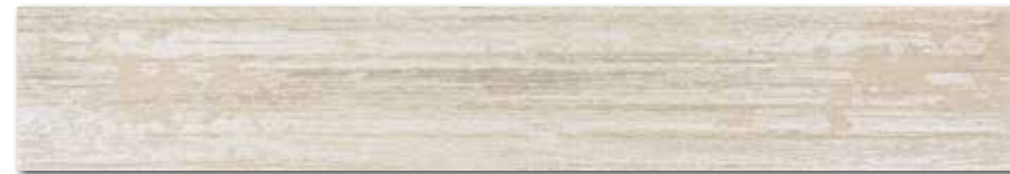
DDTV6023 PEI 4 ○ 102 / ks mat | matt

běžová-tyrkysová / beige-turquoise / beżowa-turkusowa / бежевый-цвет морской волны / bézs-türkiz / beige-turquesa