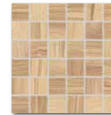
DDM06142 (SET) PEI 4 ○ 72 / set mat | matt

světle béžová / light beige / jasnobezowa / светло-бежевый / világosbézs / beige claro