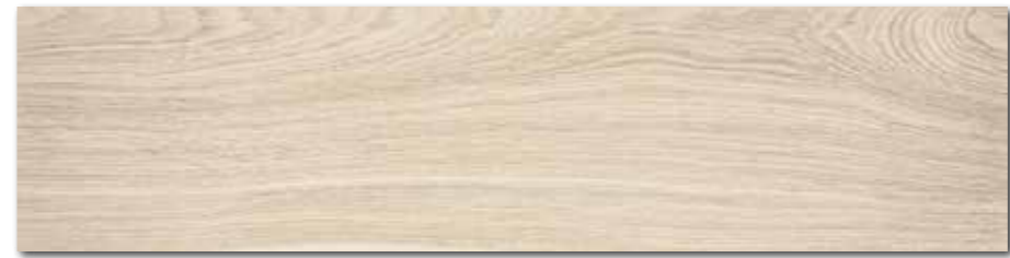
DAKVF141 PEI 5 \odot 98 / m 2 mat | matt